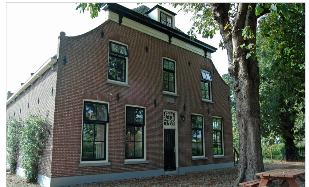
4. Een geheel ander boerenhuis, maar wel losstaand van de schuur, is “De Smousenhoek” aan de Hazersweg 23 in Ouddorp.