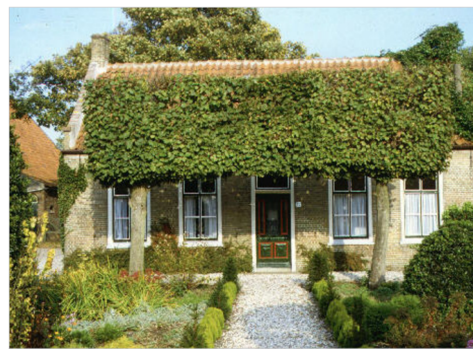
3. Afgebroken boerenhuisje aan de Dirkdoensweg 12 in Ouddorp.

Ook hier was sprake van een zeer eenvoudig boerenhuisje. Op de regiokaart in de Atlas van Kips (1830) lijkt er nog een grotere losstaande schuur pal achter het boerenhuisje te staan. Het nog beschikbare fotomateriaal uit de vroege jaren zestig van de 20ste eeuw laat echter alleen nog een onsamenhangende verzameling schuurlijzen en aanbouwen zien, die landbouwschuur was toen al afgebroken. Dit boerenland werd begin jaren zestig geruimd om plaats te maken voor het recreatiegebied de “Klepperstee”. Qua opzet vertoont het boerenhuis enige overeenkomst met het grotere “Stadtwijk”.