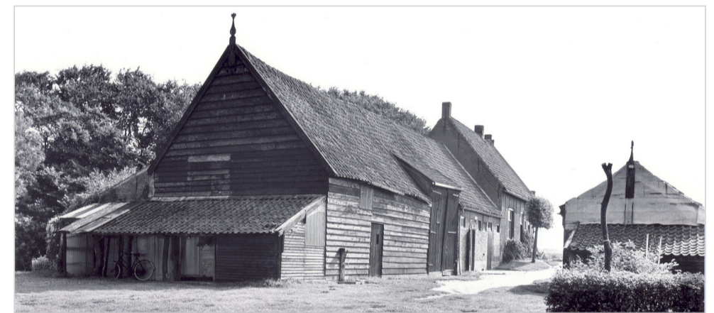
6. Een historische dwarsdeelschuur met één stel mendeuren.

In herbouwde staat herbergt de schuur het VVV-kantoor, in de historische situatie was hij het prototype van de ‘Vlaamse’ schuur. De vol geladen wagens gingen er hier in om er aan de andere kant leeg uit te rijden. Rechts van de langside lag de koeienstal, links de tassen.