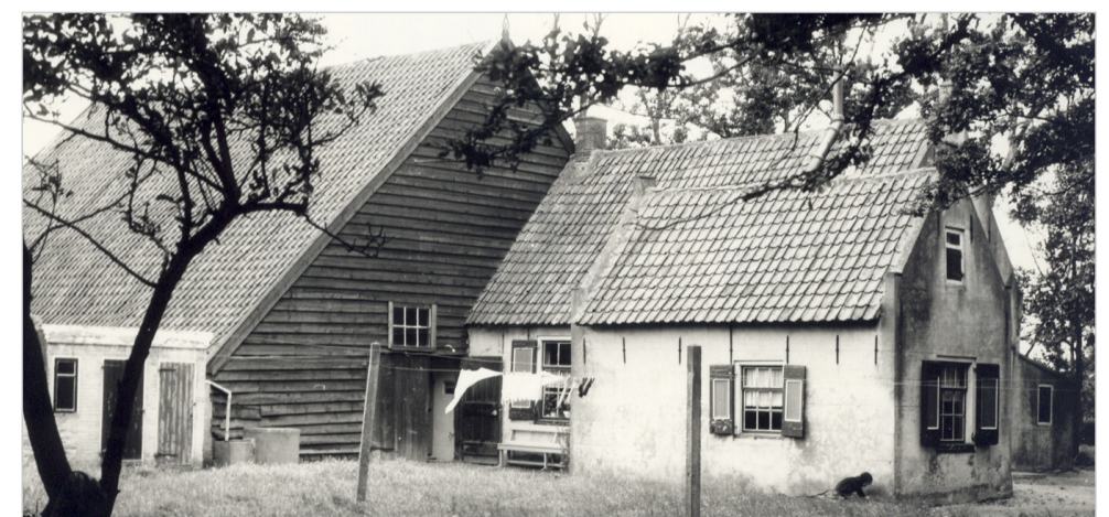
7. De al decennia geleden afgebroken ‘Vlaamse’ schuur van boerderij “De Stee van de jongens”, hoek Koolweg-Oudnieuwlandseweg.

Dit is de historische schuur van de nog bestaande, maar sterk gemoderniseerde boerderij “De Verloren Kost” aan de Westduinweg 1 in Ouddorp. Het boerenland is jaren geleden al omgetoverd tot camping “Zuidhoek”. Opvallend is dat de mendeuren iets boven de dakvoet van de schuur uitsteken. De oude dorsvloer, die direct achter de mendeuren ligt, staat dwars op de lengteas van de schuur.