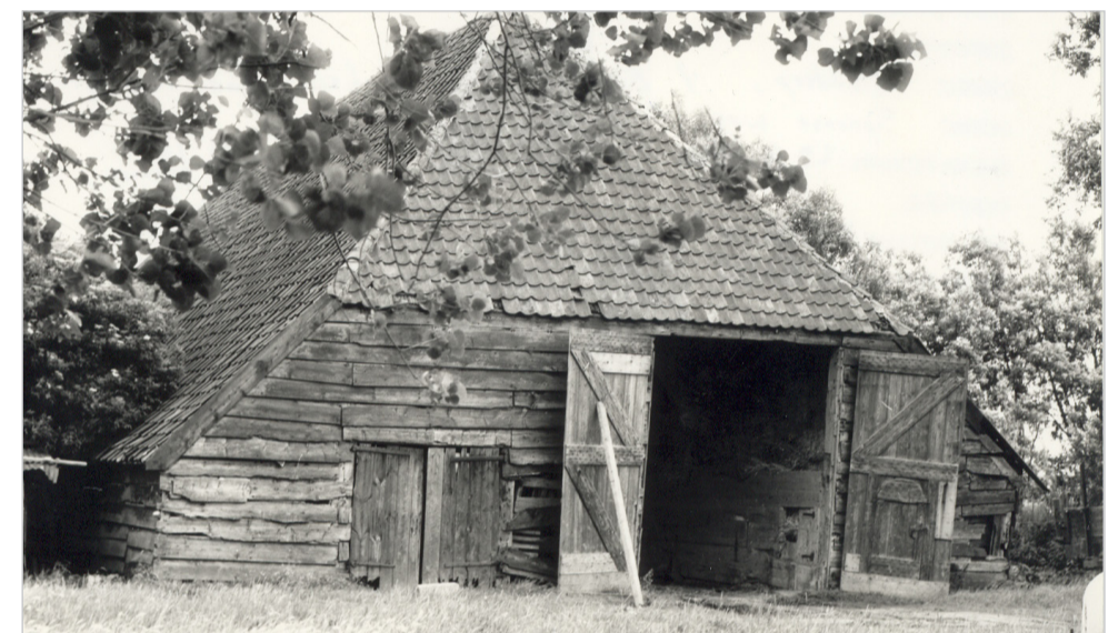
5. De achterkant van de historische schuur van “t Blaauwe Huus”.

Volgens de gevelsteen boven de voordeur werd dit statige pand in 1872 gebouwd. Wat nergens anders op Goeree-Overflakkee bij boerenhuizen is te vinden, is het schitterende ‘snijraam’ boven de voordeur. De boerenfamilie heeft op deze wijze haar welvaart willen laten zien. De grote landbouwschuur (links gelegen van het huis, buiten beeld), met daaraan vast gebouwd de wagenschuur, stond met zijn lengteas loodrecht op de as van het huis. Vorig jaar werd de langsdeelschuur afgebroken voor woningbouw, het boerenhuis kon gelukkig gespaard worden.