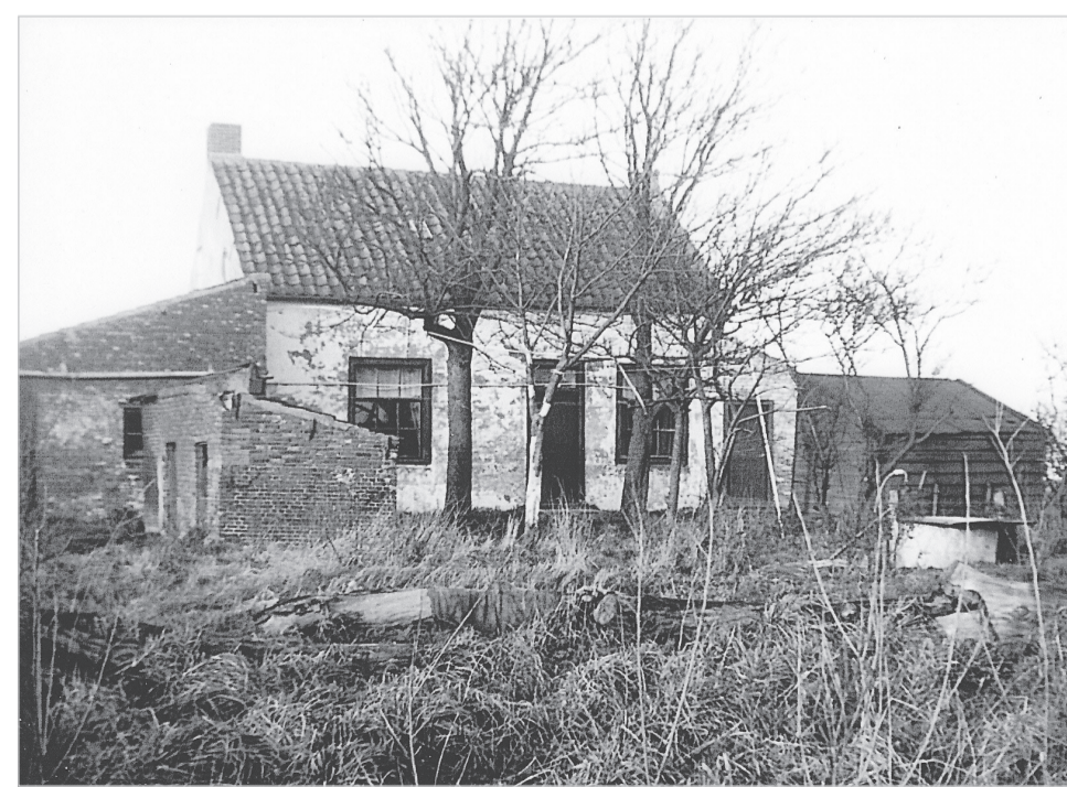
2. De afgebroken 18e-eeuwse “Klepperstee” (toegang ooit aan de Klepperweg) in Ouddorp.

Deze boerderij is hoogstwaarschijnlijk een voor bewoning geschikt gemaakt restant van het oude buiten “Stadtwijk”. De voorgevel straalt nog enige allure uit door de chique voordeur en de oude gevelsteen daarboven. Op de hoek van de voor- en zijgevel zijn de luiken van de kelderingang aan de buitenkant zichtbaar; dit kwam bij geen enkele boerderij op het eiland voor. Het huis lijkt in deze situatie meer op een grote arbeiderswoning. De boerderij heeft de Watersnood van 1953 niet doorstaan. Op deze plek kwam een herbouwboerderij te staan. De gevelsteen werd ingemetseld in de nieuwe schuur.